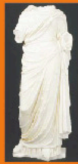
Museo - 4