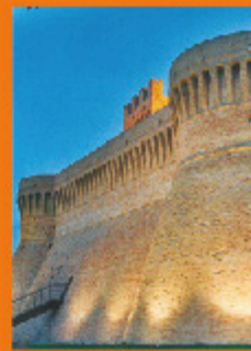
Rocca - 1