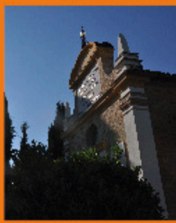
Sacrario - 7

Numeri Utili Ufficio Turistico (+39) 0733.506566 Comune (+39) 0733.511091 Carabinieri (+39) 0733.506528 www.urbisaglia.com